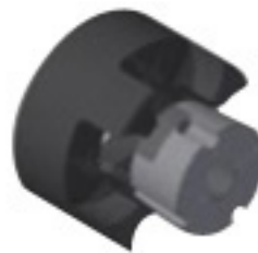
Serraggio interno - MOZZO "I"