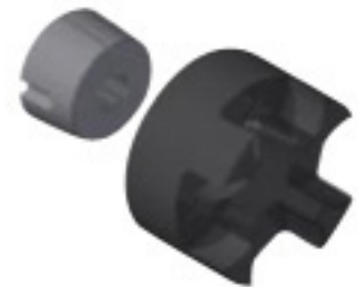
Serraggio esterno - MOZZO "E"