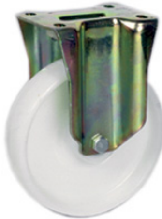
TIPO 85 Supporto Pesante SF_P