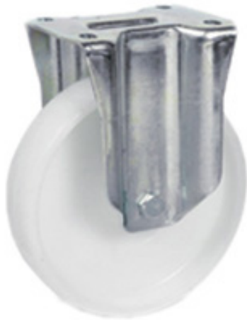
TIPO 51 Supporto Leggero SF