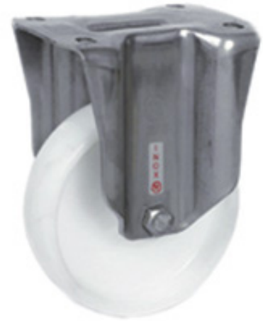
TIPO 54 Supporto Leggero INOX SF_NLX