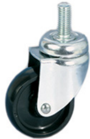
TIPO 61 SRC