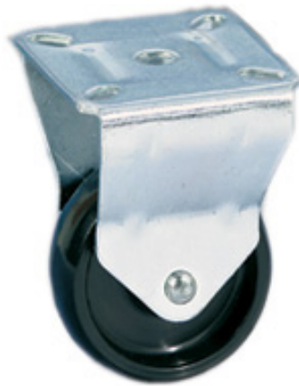
TIPO 51 SF