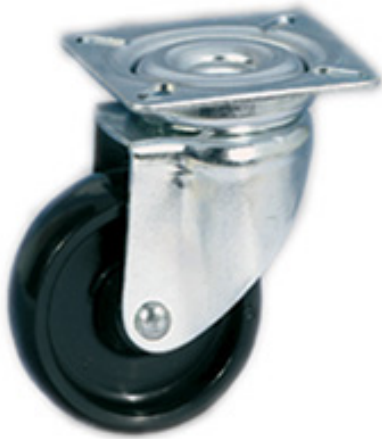
TIPO 41 SRP