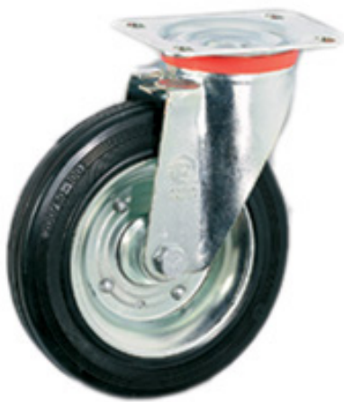
TIPO 49 - 50 Supporto Leggero SRP