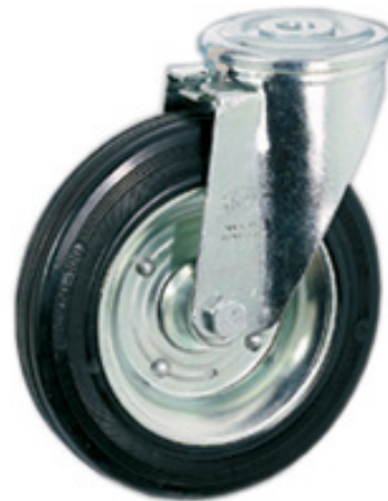
TIPO 77 Supporto Leggero CON FORO PASSANTE SR_FP