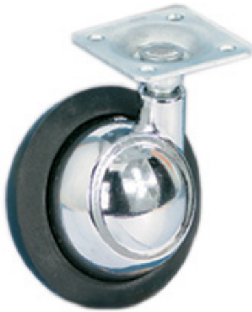
TIPO 41 - 42 SRP