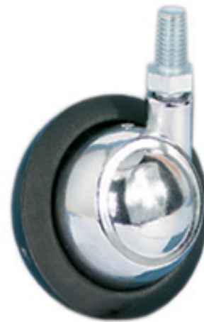
TIPO 61 - 62 SRC